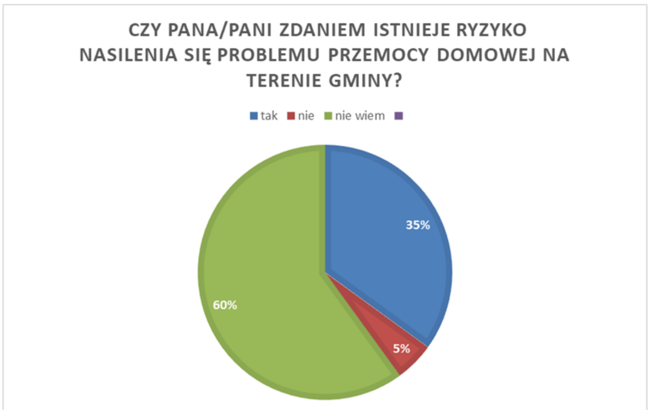
Wykres nr 2

Z kolei drugi wykres wskazuje czy na terenie gminy, wg społeczeństwa zjawisko przemocy domowej będzie się nasilać czy też nie. Z danych wynika, że mieszkańcy nie mają zdania na ten temat, aż 60%. 35% przyznaje, że istnieje ryzyko wzrostu tego zjawiska. To pokazuje, obawy mieszkańców i brak wiary w istniejące procedury.